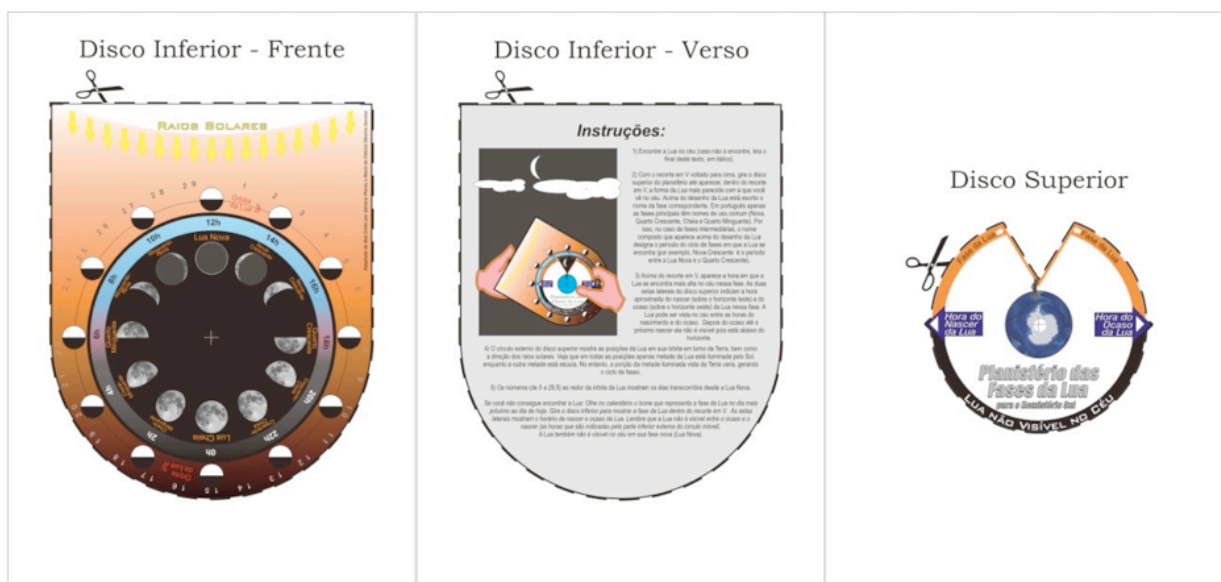
Figura 1: Páginas do arquivo para impressão do planisfério lunar disponível para download.

O presente planisfério lunar é uma adaptação da “Moon Gazer’s Wheel”, de Bob Crelin (2009), feito para o hemisfério norte. É formado por um disco inferior, maior, e outro superior, menor, solidariamente unidos por uma presilha, que permite que um disco gire livremente sobre o outro. O disco superior possui um corte em “V”, cujo espaço permite visualizar, no disco inferior, a fase da Lua que se quer identificar. O planisfério lunar para latitudes do sul do Brasil está disponível para efetuar o “download” para impressão na rede ( http://www.if.ufrgs.br/~fatima/planisferio/planlunar/planisferio-lunar-hem-sul.pdf ) e pode ser visualizado na figura 1, onde aparece a frente e o verso do disco inferior e o disco superior. Na página onde está disponível o planisfério encontram-se também as instruções de montagem.